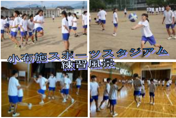
小布施スポーツスタジアム 練習風景